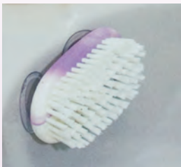
- krtačka za nohte