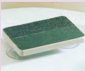
- pilica za nohte